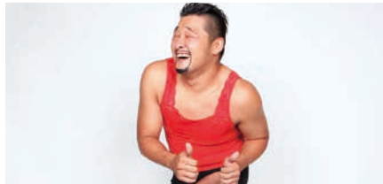
安次嶺周/CDジャケットなどのグラフィックワーク、イラスト作品制作の一方、粒マスタード安次嶺としてダンスパフォーマンスでも大人気。幅広く表現活動を展開。