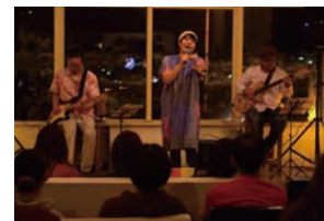
2013年10月に宜野湾市のカフェユニゾンで開催された個展「島の女」ではライブイベントも開催。静と動の両方で、独特の世界観を表現した。

自然本来が持っている生命力やエロスを十分に実感できる場所がたまたま沖縄なのかもしれません。そういったものは多くの芸術家のインスピレーションの源になっていると思います。少なくとも私はそうなんですけどね。」