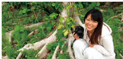
西美都/東京生まれ。東京工芸大学写真学科卒業。現在、沖縄を拠点に、撮影した写真を拾い集めた流木のフレームにおさめた作品を制作。