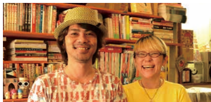
アトロン/友寄司とエノビ☆ケイコによるアートユニット。イラスト、キャラクターデザイン、アニメーション、アートディレクションなど県内外で幅広く活動。