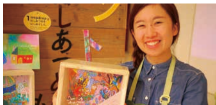
sava/沖縄市の商店街に住みながら作品を製作し続け、絵本作家に。地域に密着した表現活動は広く評価され、さまざまな賞も受賞。