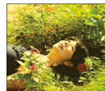
サードアルバム「夢ヲミタ」。ワールドミュージックのエッセンスが効いた、上質なアコースティックサウンド。