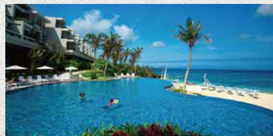
ラグーンプール [屋外4~11月] LAGOON POOL