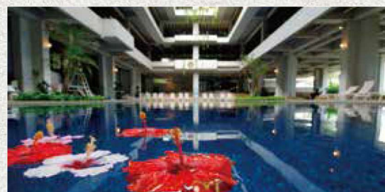
アトリウムプール [半屋外 通年] ATRIUM POOL

※[4月~11月] 9:00~20:00 [12月~3月] 13:00~20:00 ※社会情勢等により営業時間が異なる場合がございますので 詳細はHPをご確認ください。 https://www.moonbeach.co.jp/activities/