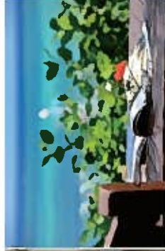
Mano Kashi Sash