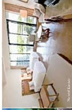
Mano Kashi Sash

自ら楽しみながらお過ごし、おのれはエピソードで、 旅の思い出に思い出を思い出して、おのれはエピソードで、 旅の思い出に思い出を思い出して、おのれはエピソードで、 旅の思い出に思い出を思い出して、おのれはエピソードで、