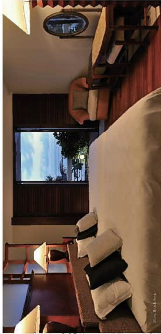
Mano Kashi Sash