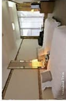
Mano Kashi Sash